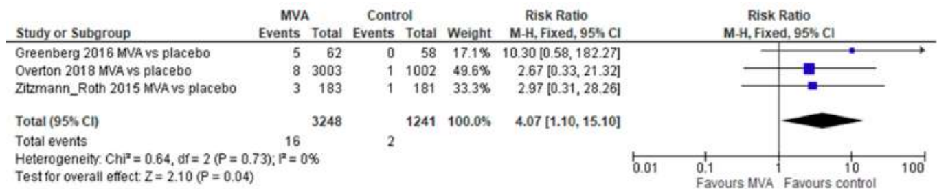
Figure 2. Adverse events of special interest following both MVA doses.