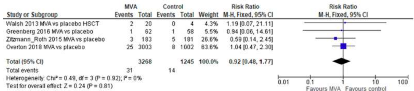
Figure 3. Serious adverse events following both MVA doses.